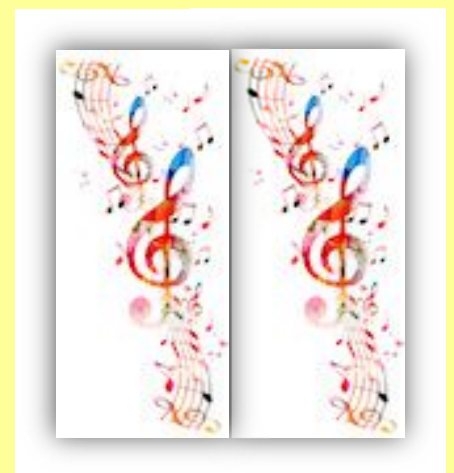
Städtisches Blasorchester Heidenheim e.V. 1889

Veranstalter: Georg-Elser-Freundeskreis, Humanistischer Freidenker-Verband Ostwürttemberg K.d.ö.R. und „Gegen Vergessen, für Demokratie e.V.“ Regionale AG Ostwürttemberg.